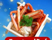
พิเศษ! ซาปูฮิกัน